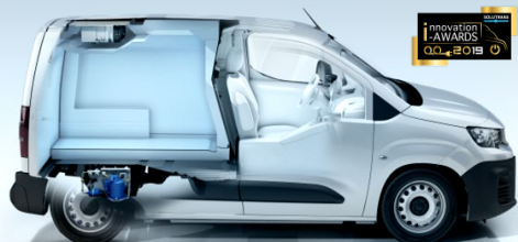
Groupe intégré sous-châssis Kerstner e-Cooljet 106